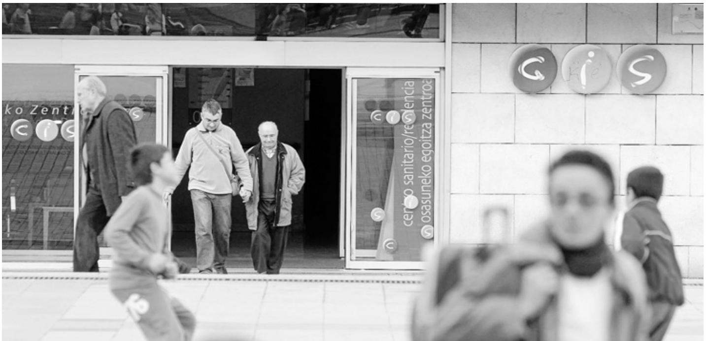
Entrada del Centro de Integración Sociocultural de Los Hermanos, en Barakaldo, que cuenta con un centro de día, entre otros servicios.

an sido necesarios trece años de relación a prueba de todo tipo de informes oficiales, para que Rodríguez esté a punto de decir adiós a la gestión de los dos equipamientos por parte de la corporación de empresas que se agrupan bajo el