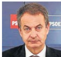
José Luis Rodríguez Zapatero Presidente español

= No se trata de defender a Gadafi, algo imposible, sino de pedir responsabilidad a quien, como Rice, puede contribuir al final de ese régimen. Y esa responsabilidad no pasa por declaraciones epatantes sin dar pruebas, sino por poner los medios necesarios para impedir que hechos similares sean realidad.